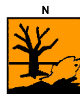
Nebezpečný pre životné prostredie

15.1.2. Názvy chemických látok uvádzaných v texte označenia obalu: hydroxid meďnatý CAS 20427-59-2